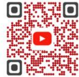
IALIDRA en vidéo